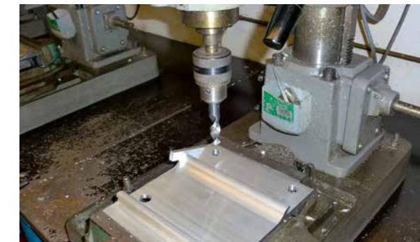
An dieser Standbohrmaschine werden Wandhalterungen gebohrt.

Es gibt viele Sicherheitsvorschriften, die hier befolgt werden müssen.