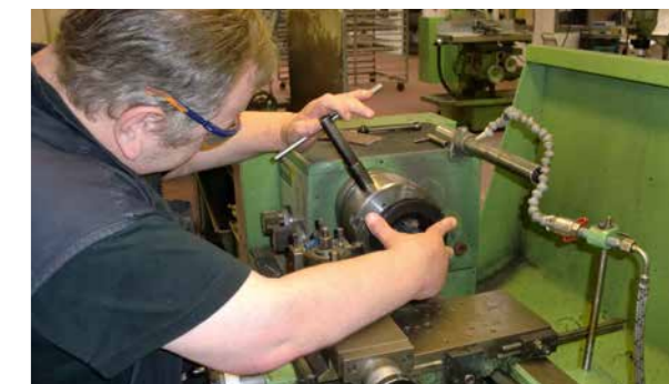
Eine Drehmaschine. Vorsicht! Gefährlich!