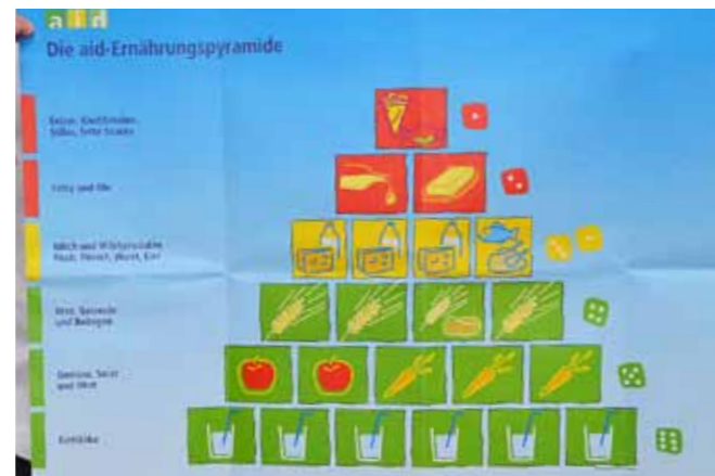
Die Ernährungspyramide zeigt, wovon man viel essen kann und wovon man wenig essen sollte.