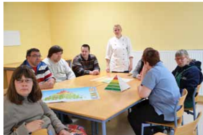
Die Teilnehmerinnen und Teilnehmer der „Kleinen Ernährungsschule“ treffen sich regelmäßig.